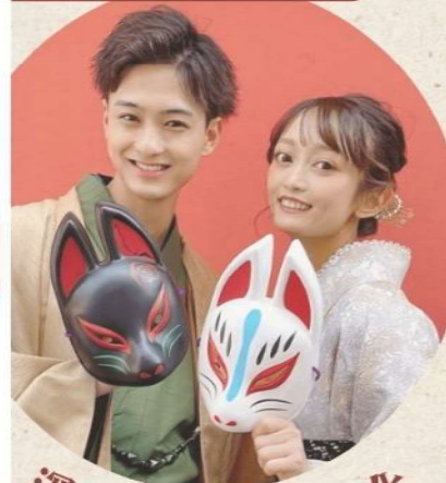
深度體驗日本文化